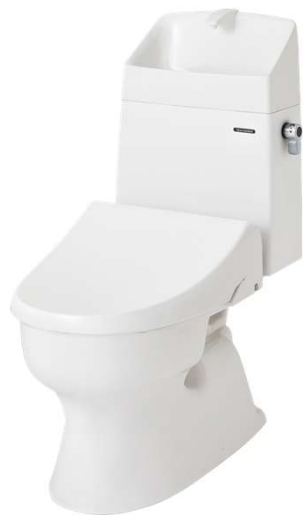
温水洗浄便座タイプ